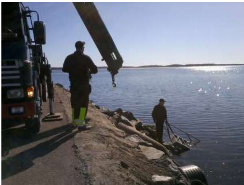
Räddningsinsats för badstegen mars 2011

Föredragningslista, verksamhetsberättelse, ekonomisk redovisning, valberedningens förslag och styrelsens och medlemmars motioner följer med kallelsen. Kallelsen finns även på vår hemsida www.storaenen.se , flik ”årsstämma”.